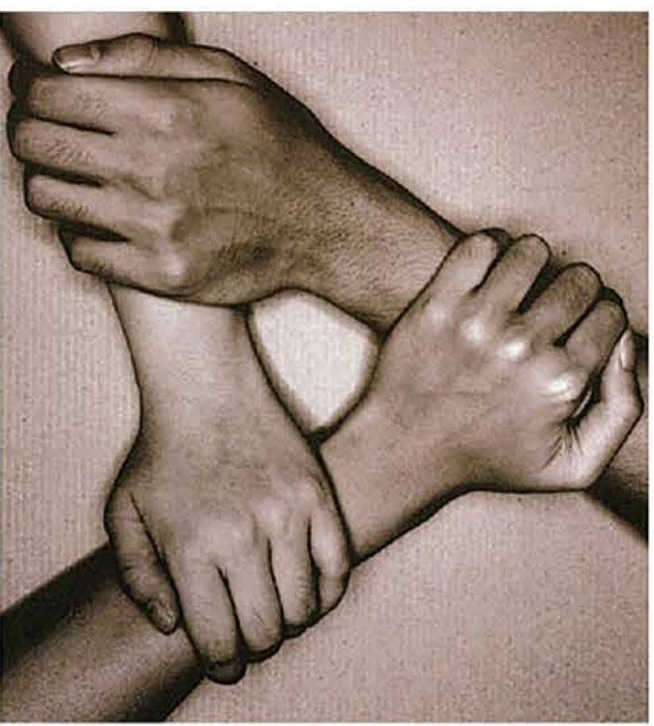
版面內容由「與愛同行」提供

神的道是活潑的，是有功效的，比一切兩刃的劍更快，甚至魂與靈，骨節與骨髓，都能刺入、剖開，連心中的思念和主意都能辨明。